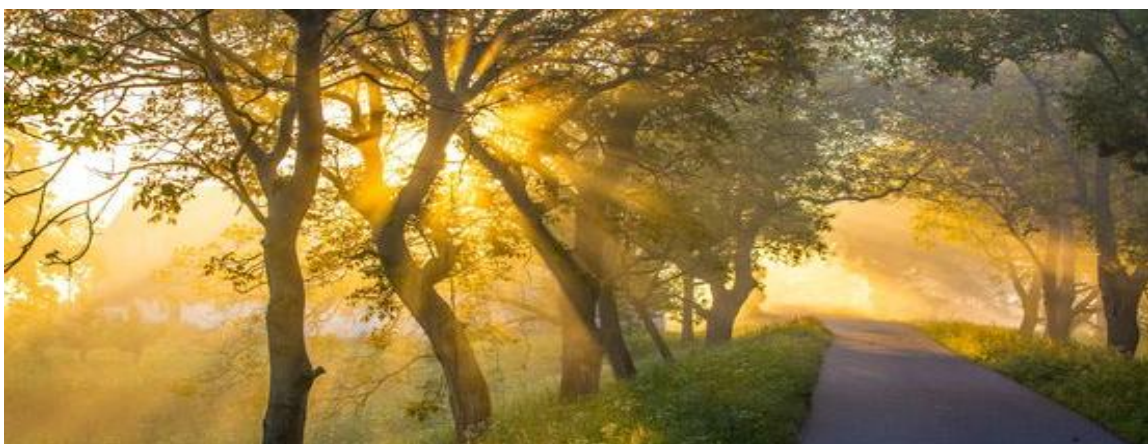
Dauwtrappen op Hemelvaartsdag